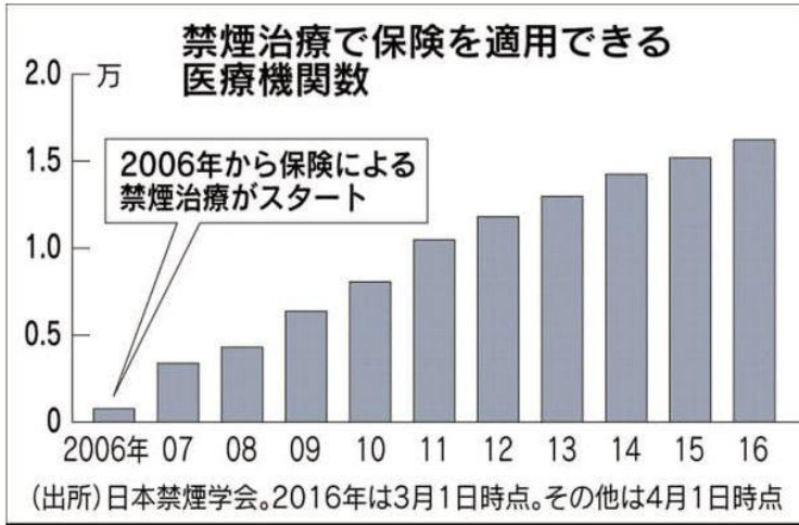
NIKKEI STYLE サイトから

皆さん「禁煙外来」って知っていますか。タバコをやめたいと思っているニコチン依存の喫煙者に、禁煙できるよう治療してくれる医療機関の名前です。左のグラフは、その数を示したのですが、年々