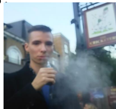
路上で電子タバコを使用したときの受動喫煙 (ロンドン市内にて撮影)