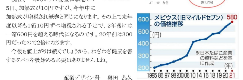
産業デザイン科 奥田 恭久