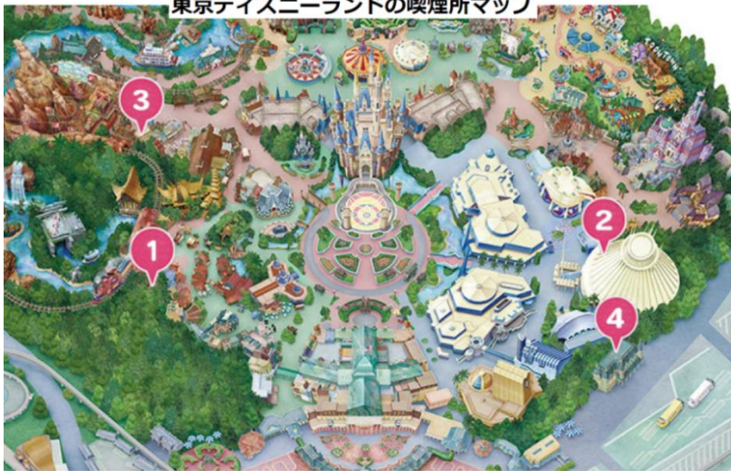
トゥモローランドエリアの喫煙所：人気があって混雑しがち（キャストの誘導あり）