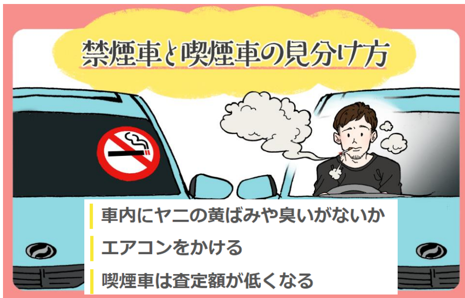
Gulliver 「クルマの基礎知識」 サイトから

皆さんが自分のクルマを持ち日常的に運転するようになるのはまだ先になりますが、将来のために、こんな事情も知っておいて下さい。そして、タバコを吸い始めないで下さい。