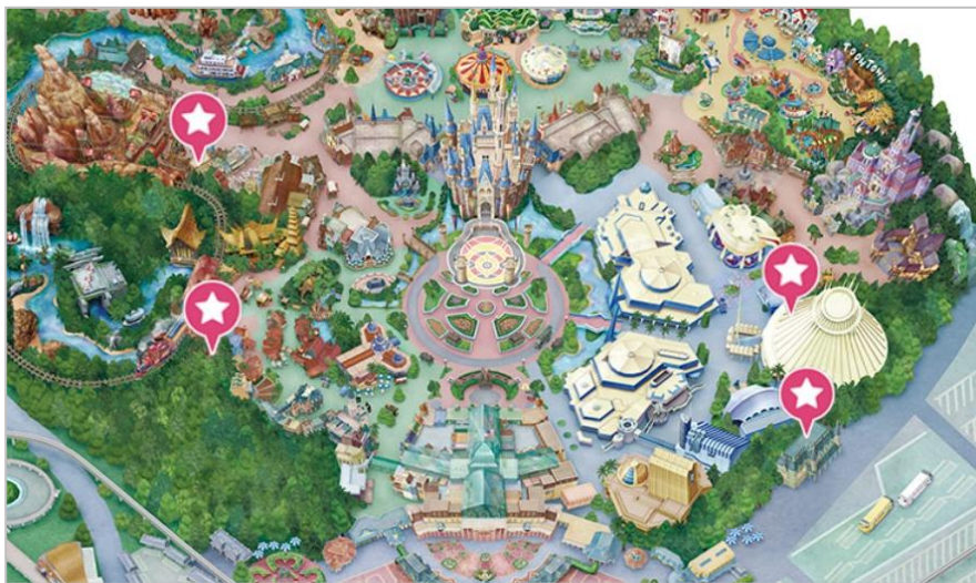
東京ディズニーランド HP から

現在、タバコが有害である事は広く社会に浸透しているため、多くの施設では喫煙場所以外での喫煙は禁止されています。下図は東京ディズニーランドのマップですが、広い敷地の中でタバコを吸えるのは星印の場所だけです。