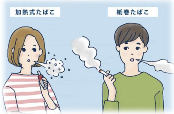
ClubSunstar 「カラダのこと」サイトから