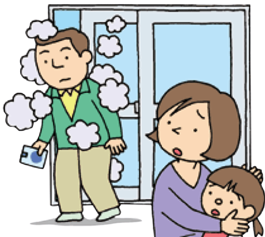
環境再生保全機構 HP「すこやかライフ」から

他人のタバコの煙を吸わされるのが受動喫煙です。喫煙者が手にした火の着いたタバコからでる副流煙や吐く息などを吸い込むことなのですが、煙はなくてもタバコの不快なニオイを感じることがありますよね。下のイラストのようにタバコを手にしていなくても、ついさっきまでタバコを吸っていた喫煙者が近くにくると、いやなニオイを感じます。