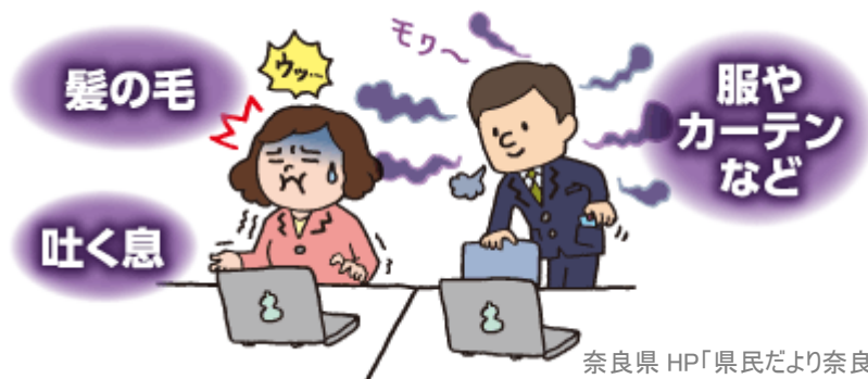
奈良県 HP「県民だより奈良」から

煙はなくてもニオイがあると言う事は、タバコの成分が漂っているわけです。目に見えないすごく微小な成分なのですが、このニオイを不快に感じる人は多いのではないのでしょうか。