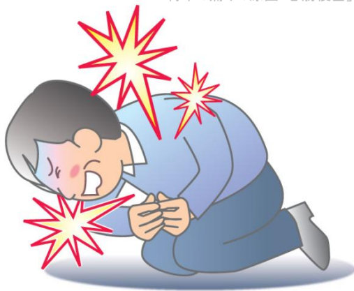
Minds ガイドラインセンターHP から

このような病気は“虚血性心疾患” きょけつせいしんしつかん と呼ばれ、厚生労働省の発表によると、昨年(平成27年度)約7万人が死亡したそうです。