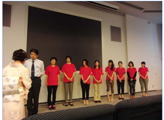
お世話になった九州大学のみなさん