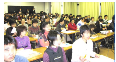
熱心に受講される皆さん

全国の多くの県で開催されている全国禁煙アドバイザー育成講習会ですが、長崎開催は初めてのこと。また長崎県では禁煙支援に関する事業の取り組みが他県の様子からして遅れている感じがある中、参加して下さる数が全く読めなかったため、プログラムのタイトルにキャッチコピーをつけていただきました。原先生のアドバイスです。タイトルだけでわくわくする内容です。